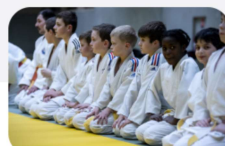
L'ACTIVITÉ ET L'OFFRE SPORTIVE