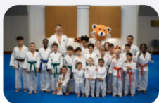
LE PROJET CLUB

Les critères de sélection reposent sur 4 socles de développement :