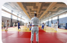
LA DYNAMIQUE DU CLUB