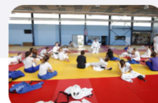
L'ENCADREMENT ET LA FORMATION

La campagne de labellisation comporte 4 niveaux correspondant à un nombre total de points des différents socles de développement :